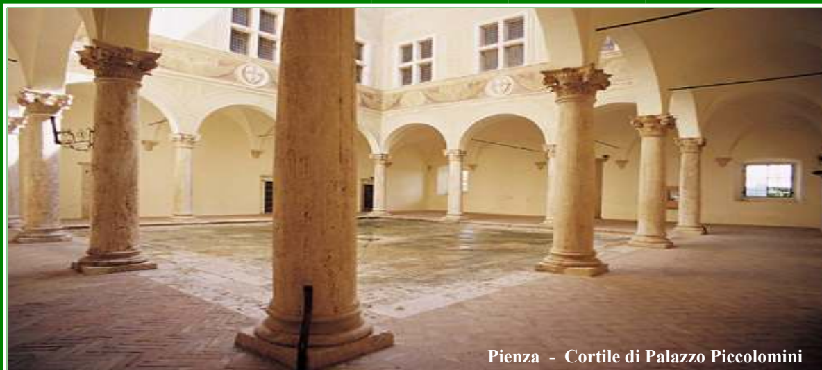
Pienza - Cortile di Palazzo Piccolomini

ART.21 A insindacabile giudizio dell'organizzazione il Concorso potrà essere rimandato o annullato per cause di forza maggiore. In questo caso la quota di iscrizione verrà interamente restituita.